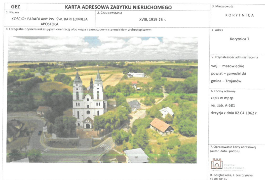
Rysunek 1 Przykładowa karta GEZ -awers