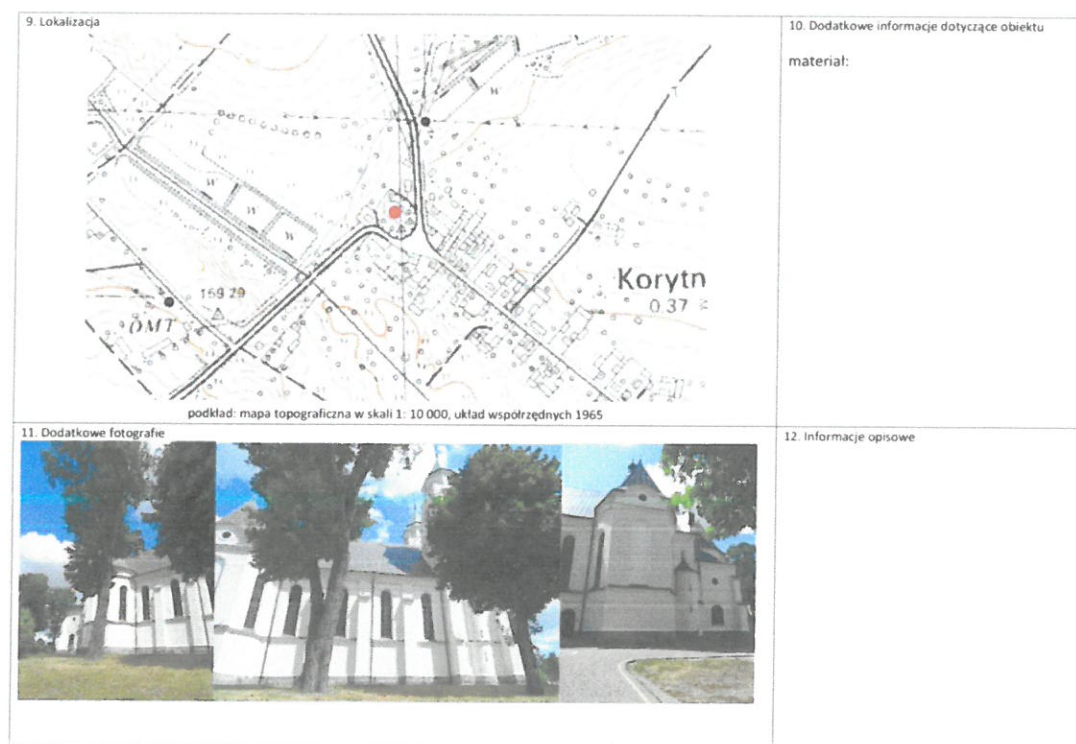
Rysunek 2 Przykładowa karta GEZ -rewers